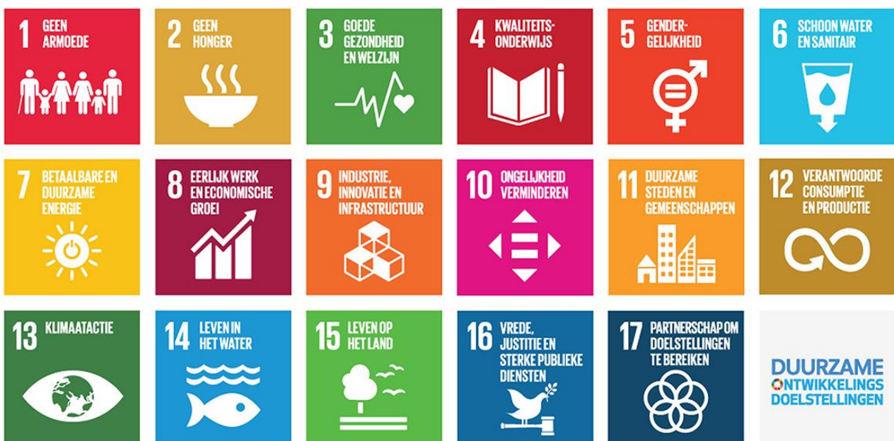
Figuur 1. Sustainable Development Goals

De Verenigde Naties (VN) heeft oorspronkelijk de 17 ontwikkelingsdoelen opgesteld, de Sustainable Development Goals (SDG's), om de armoede in de wereld te bestrijden, economische groei te bewerkstelligen en goed voor het klimaat te zorgen. Dit is de oorsprong voor de ESG-principes.